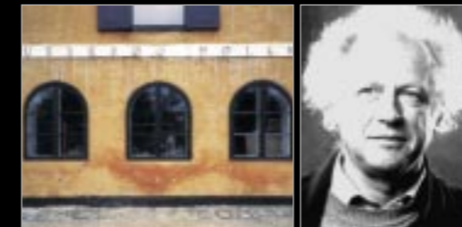
Usseørd Mølle, Anno 1760, Hauptsitz von XO CARE A/S

XO CARE bedeutet Dental care made eXtraOrdinary. Wir glauben, dass gut gestaltete Qualitätsprodukte die richtige Antwort auf die Bedürfnisse der Dental-Teams sind. Zusammen mit unseren Partnern streben wir danach die Besten bei Beratung, Schulung oder Service zu sein – vor, während und nach dem Verkauf. Wir hören immer gerne zu und arbeiten mit Ihnen und unseren Partnern eng zusammen.