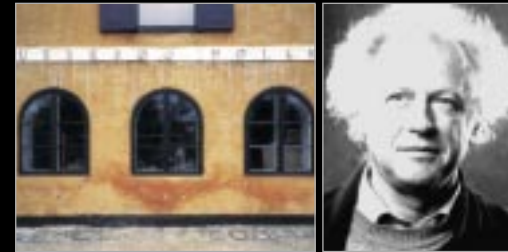
Usserød Mølle, Anno 1760, Hauptsitz von XO CARE A/S

XO CARE A/S hieß früher Flex Dental A/S. Die Firma unterstützt seit 1951 Dental-Teams. XO CARE bedeutet Dental care made eXtraOrdinary. Wir glauben, dass gut gestaltete Qualitätsprodukte die richtige Antwort auf die Bedürfnisse der Dental-Teams sind. Zusammen mit unseren Partnern streben wir danach die Besten bei Beratung, Schulung oder Service zu sein – vor, während und nach dem Verkauf. Wir hören immer gerne zu und arbeiten mit Ihnen und unseren Partnern eng zusammen.